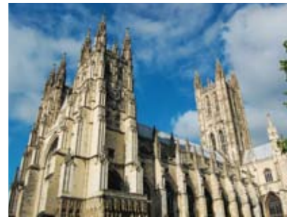
Bilder: Stora bilden: Frihet. Konfirmander från Ryd på väg mot Canterbury.